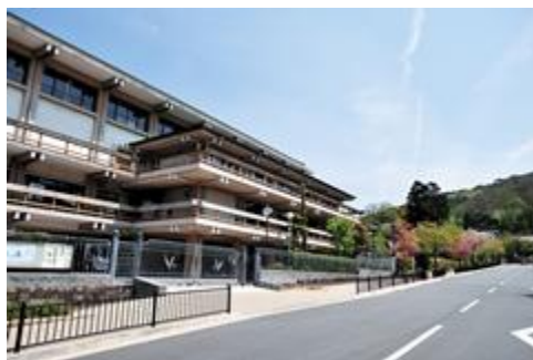
緑に恵まれ、四季を通して落ち着いた校舎の様子

また、この資格は将来役立ち、大学生や社会人など多くの方に支持をされているので生徒にも人気の資格です。1年目はWordのみ実施していましたが、2年目になり生徒からの要望や進学に役立つということでExcelも採用することになり、授業の受講者も前年度より大幅に増えました。