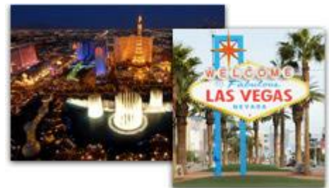
アメリカ・ラスベガス